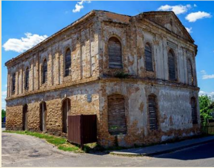
בית הכנסת הגדול בעיר קרלין

נוסעים אצל מורו רבי שלמה מקרלין ז"ל היו בבחינת וצבא השמים לך משתחוים."