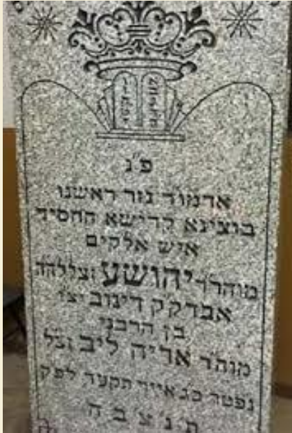
מצבת ציונו של הרה"ק רבי יהושע מדינוב באהל בביה"ח העתיק בדינוב

ובכן אבא אל המלך, ויהא רעוא לפני השי"ת שנוכה להכין את עצמנו לימי נוראים הקדושים בהכנות טובות בתשובה ומעשים טובים ויחדש הש"י עלינו שנה טובה ומתוקה ושנה טובה מעוטרת ומבורכת, ונוכה לגאולת עולם גאולה נפשיות וגופניות ונשיג ששון ושמחה לעבודת השי"ת אכיה"ר.