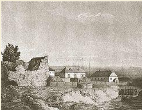
מראה העיר קרלין אליו נסע רביה"ק השרף זי"ע אל רבו הקדוש [כיום ברבר העיר פינסק שבבולרוס]

ועוד הוסיף ואמר על זה {שם אות נ"ו}: "הנה הצדיק הוא שורש מנשמות ישראל, אבל מורי רבי שלמה מקרלין היה שורש משרשים, כי גם האנשים אשר היו נוסעים אליו היו כמה שורשים מכמה וכמה נשמות ישראל, וזה הטעם שנוסעים אלי כמעט יותר אנשים ממה שהיו נוסעים למורי רבי שלמה מקרלין ז"ל".