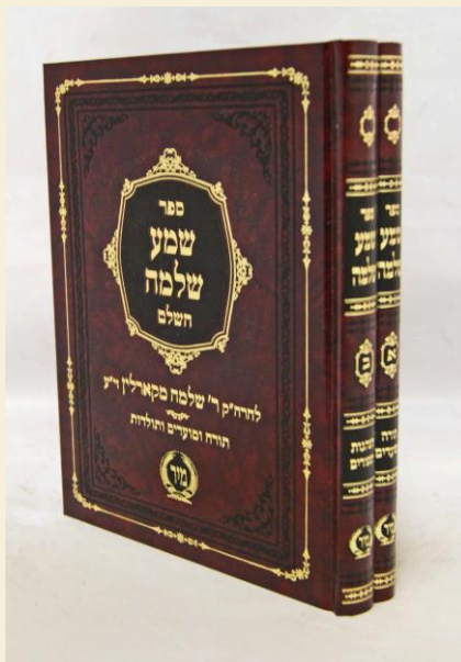
שער ספה"ק שמע שלמה להרה"ק רבי שלמה מקארלין ז"ע

וכשבא אל הרה"ק רבי ייב"א אמר לו אני איני רבך אבל טובה אחת אעשה לך, אני כבר לא אשלח אתכם מצדיק לצדיק אלא אשלח אותך לצדיק ששורש נשמתיך שם, תלך להרב הקדוש רבי שלמה קרלינער, ומיד בקבלתך ממנו שלום תאמר לו שאתה רוצה להיות אצלו לתלמיד למשך שבע שנים ובוא יקבל אותך."