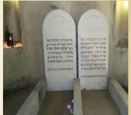
ציון הקדוש של הרה"ק רבי שלמה הלוי מקארלין זי"ע בעיר לודמיר

"הרה"ק ר' אורי צוק"ל מסטרעליסק, היה דר אחר הנישואין בעיר לבוב, והנה ביקש לו רבי ולא ידע אל מי לפנות והתיישב בדעתו ליסע לליז'ענסק אל הרב הקדוש ר' אלימלך צוק"ל, ונסע אליו על ר"ה יו"כ וסוכות. ובערב סוכות, לעת ערב, בא הרב הקדוש ר' אלימלך לבית מדרשו, שלא היו לו מעות על נרות פן ימצא שמה איש שיהיו לו מעות ויתן לו, ולא היה שם רק הרב ר' אורי הנזכר, ואמר לו הרה"ק ר' אלימלך, אברך, יש לך מעות, תן לי על נרות, והוציא הרב אורי את כיסו ונתן לו כפי שאמר הרה"ק ר' אלימלך ונתמלא הרה"ק רא"ל בשמחה ושאלו מה אתן לך בעד זה, והשיב לו: